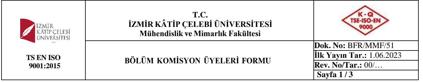
Tablo: Elektrik-Elektronik Mühendisliği Bölümü Komisyon Üyeleri Listesi